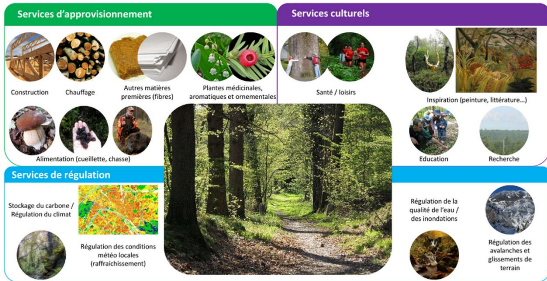
Figure 6. Exemples de biens écologiques selon les différents types d'écosystèmes.

Le système écologique naturel de bon santé contient de nombreux processus naturels ou services environnementale, qui fournissent des avantages à l'homme. Ces services environnementaux ont une nature diversifiée selon le type de système écologique (par exemple, les sols humides ne fournissent pas les mêmes services tels que la forêt (figure 06).