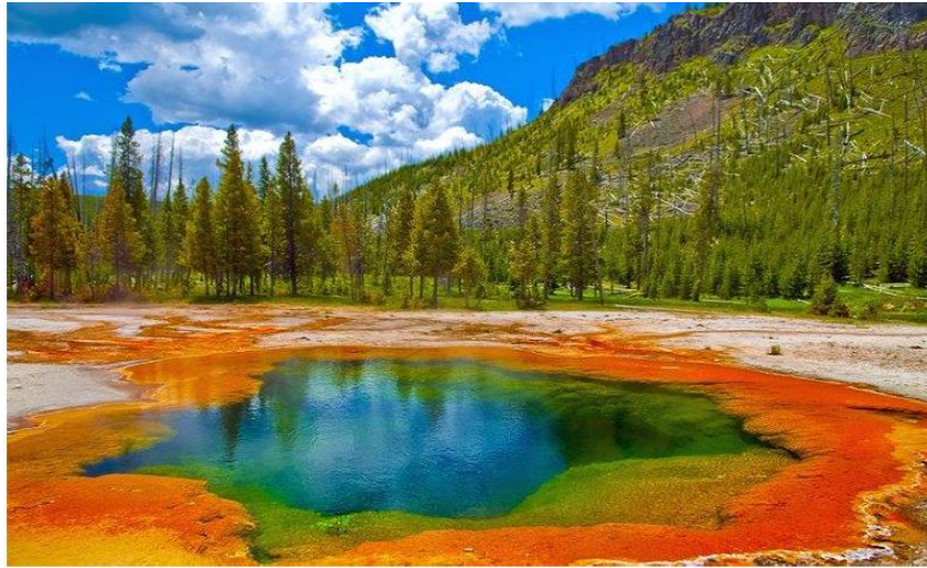
Figure 2 : Sources chaudes dans le Parc national de Yellowstone – USA.

On retrouve dans la plupart de ces écosystèmes des gaz comme H_2 , H_2S , CO_2 , ou CH_4 qui pour certains peuvent servir de sources d'énergie ( H_2 en particulier). Les micro-organismes retrouvés dans ces zones appartiennent aux domaines des Bacteria et des Archaea .