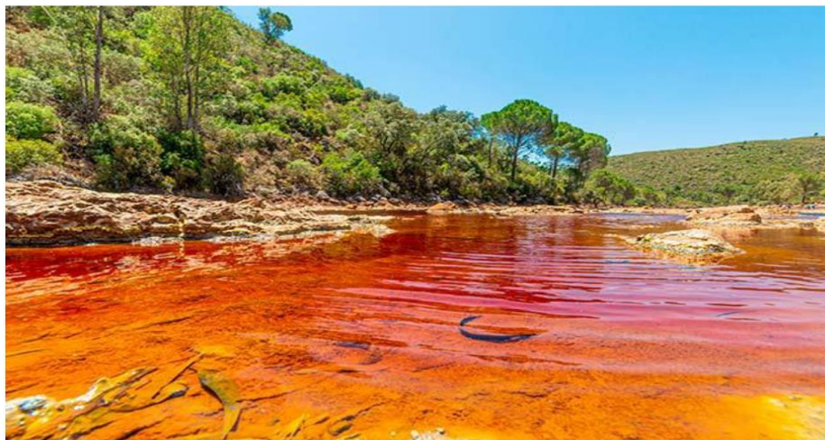
Figure 4 : Le fleuve de Rio Tinto-Espagne.

L'écosystème acide le plus étudié est le Río Tinto en Espagne avec un pH inférieur à 2, une longueur de 100 km de long, une concentration importante en métaux lourds et un surprenant niveau de diversité microbienne ( Fig. 4 ).