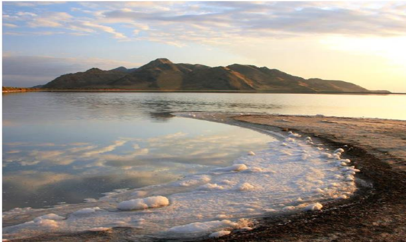
Figure 1 : Le Great Salt Lake, dans l'Utah, aux États-Unis (dépôts de sel).

Les halophiles sont des micro-organismes qui ne peuvent croître qu'en présence de sel généralement sous forme de chlorure de sodium (NaCl). Les halophiles sont classées en trois catégories : les légèrement halophiles (optimum de croissance entre 2 et 5 % de NaCl) ; les modérées halophiles (optimum de croissance entre 5 et 20 % de NaCl) ; et les halophiles extrêmes (optimum de croissance entre 20 et 30 % de NaCl). La majorité de ces micro-organismes habitent le milieu marin où la concentration est voisine de 3,5 % en sel. Il existe cependant des habitats plus spécifiques et plus localisés tels que les marais salants ou les lacs salés colonisés par les micro-organismes hyperhalophiles ( Fig.1 ).