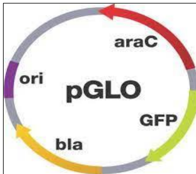
Figure 2 : Carte de restriction du plasmide pGLO

Les Plasmides sont des structure d'ADN circulaire double brin, extra-chromosomique présents dans les bactéries et ils sont capable de répliqué indépendamment du chromosome bactérien leur taille est de 3-10 Kb, sont utiliser comme des vecteur de colonage et d'expression des gènes