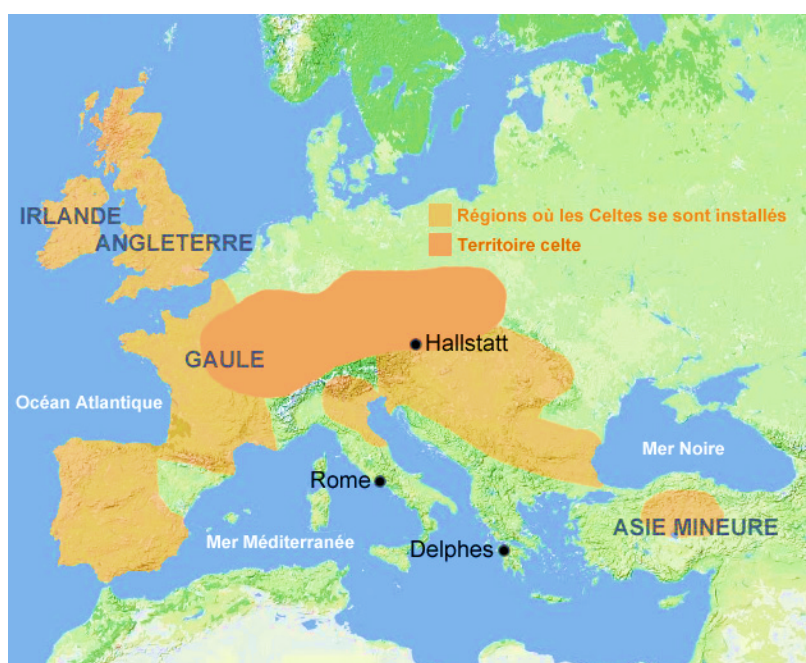
Le territoire des Celtes

L'origine du peuple français est liée aux Celtes , qui ont pénétré dans la région occidentale de l'Europe vers 1000 ans avant notre ère. Les Celtes sont un peuple issu de la famille des tribus indo-européennes, dont les Grecs et les Italiens font également partie. Leur territoire est immense : il s'étend de l'Atlantique à la Mer Noire. Ceux qui occupent la Gaule * sont les Gaulois . (voir la carte ci-dessous)