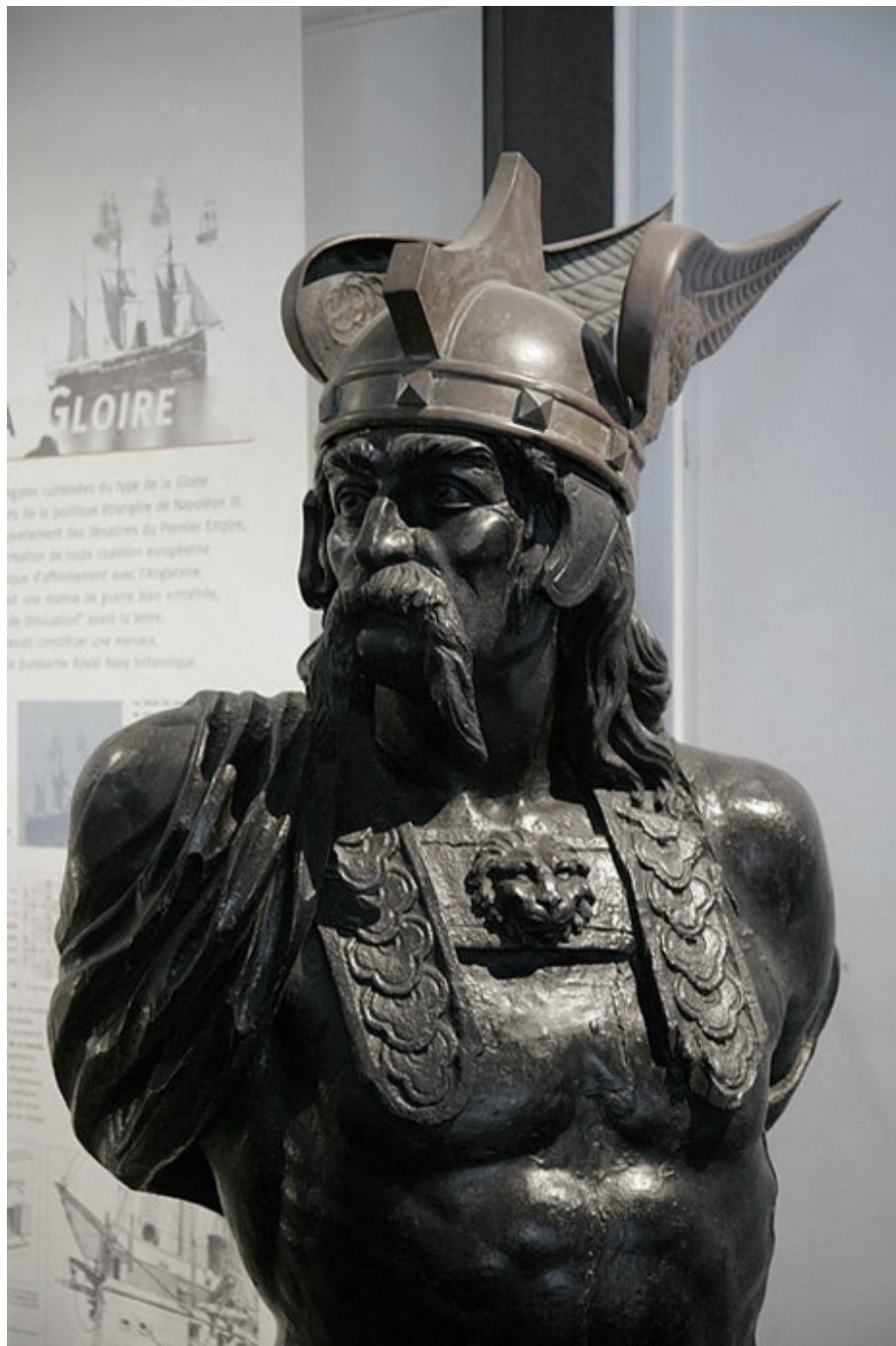
L'apparence des Gaulois

Les Gaulois vont jusqu'à Rome pour en faire le siège et pillent la ville avant de se retirer contre une forte rançon, ce qui fait preuve de leur force. Cependant, dès le III e siècle AV. J.-C. , les Romains s'organisent et résistent à l'expansion des Celtes . Le monde celtique va connaître alors une chute progressive, en laissant place à une autre puissance : l'Empire Romain . Comme pour les autres civilisations de la Préhistoire et de l'Antiquité, les Celtes n'ont pas connu une extinction brutale, mais progressive, car faisant face à une autre civilisation plus riche, plus développée, plus guerrière.