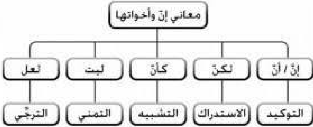
معاني إِنَّ وَأَخَوَاتِهَا