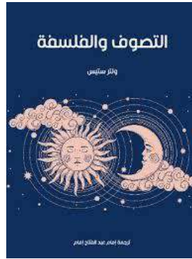
غلاف كتاب التصوف والفلسفة

وقد قارن (وين فايلد) بمقارنة بين "ما جاء في الأفلاطونية من أوصاف للواحد وما ذكره الصوفية من صفات الله تعالى كما قارن الإلهام الصوفي والإشراف الباطني عند الأفلاطونية المحدثة" ورأي ما بينهما من تشابه أو تماثل وأسس على ذلك أن الصوفية قد استمدوا ذلك من تلك الأفلاطونية الجديدة"، وقد توصل البحث الاستشراقي في هذا إلى أن هذه العلاقة ترجع إلى سنة 200هـ.