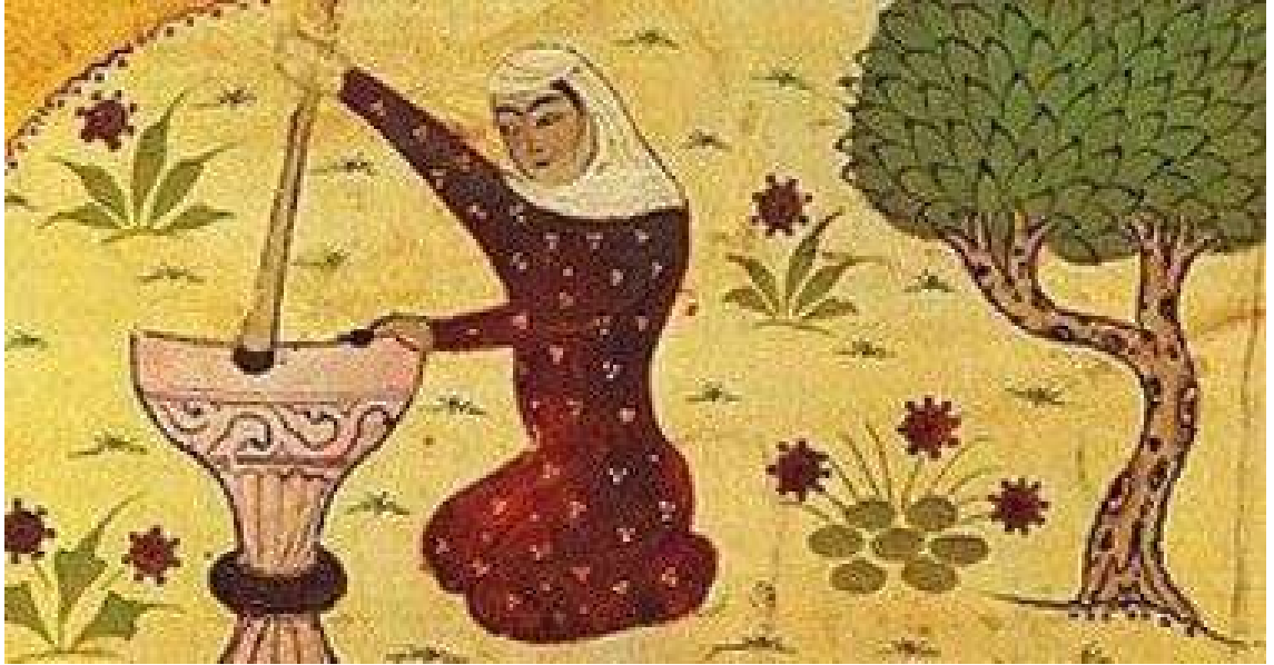
صورة متخيلة لـ رابعة العدوية

فسوف يأتي الله بقوم يحبهم ويحبونه ، أدلة على المؤمنين أعزة على الكافرين ، يجاهدون في سبيل الله ولا يخافون لومة لائم . ذلك فضل الله يؤتيه من يشاء والله واسع عليم). الشاهد من الآية (يحبهم ويحبونه). إن السالك في طريق الصوفية يرى في التواصل بينه وبين خالقه دينا أو عقيدة لا مناص منها لأهل التصوف، وقد ظهر العشق الإلهي في العصر العباسي بشكل لافت منذ القرن الثاني في بغداد، والتي تعد مدرسة تخرج منها العديد من الصوفية كالحلاج ورابعة العدوية. هؤلاء الذين لبسوا الصوف وعُرفوا به، كانوا في الحقيقة زُهّادا وادعين أكثر منهم متصوفة، فإدراكهم المستولي عليهم للخطيئة كانت تصحبه الرهبة من يوم القيامة وعذاب النار؛ تلك الرهبة التي ليس في طوقنا أن نتحققها، والتي صوّرت في القرآن تصورا حيا دفعتهم إلى أن يجدوا في الهرب من الدنيا مخلصا لهم.