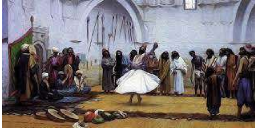
بدايات التصوف الإسلامي

الإلهي في صورة منزهة محددة"; وكانت النصوص القرآنية توضح معالم العقيدة الإسلامية للمسلمين سواء أكانوا زهاداً أم صوفية.