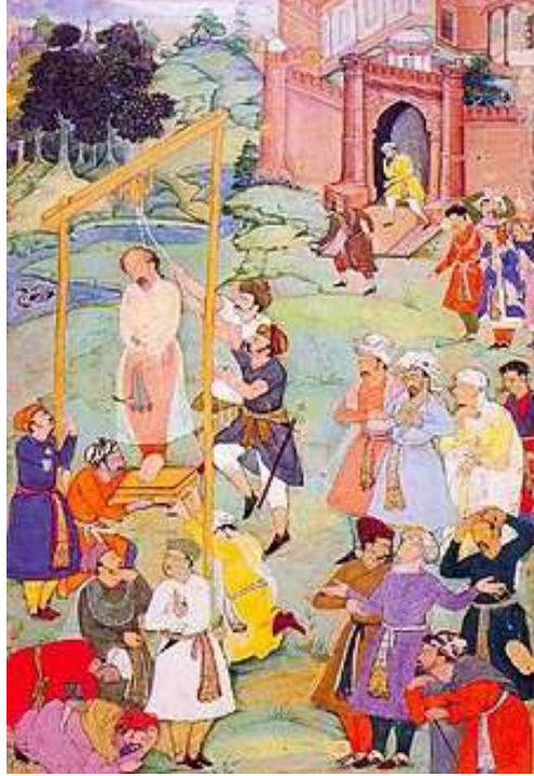
رسم يُظهر تنفيذ الإعدام بحق منصور الحلاج

مُزجت روحك في روحي كما تمرج الخمرة بالماء الزلال فإذا مسك شيء مسني فإذا أنت أنا في كل حال 1