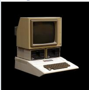
Apple II en 1977