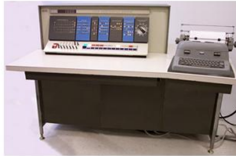
IBM 1620 en 1959