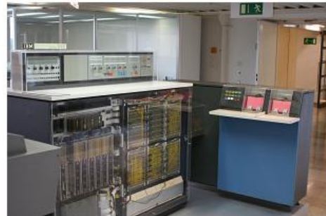
IBM 360/20 en 1965