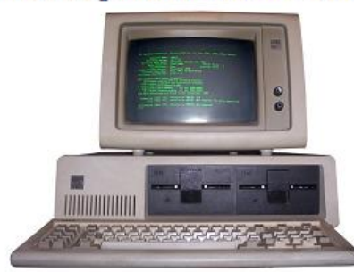
IBM PC 5150 en 1981