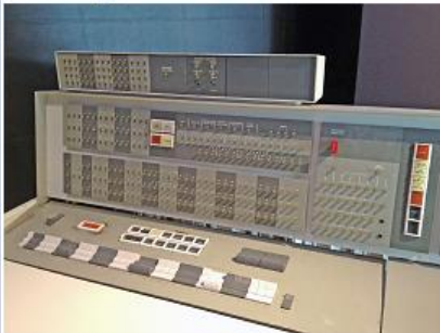
IBM 7094 en 1962