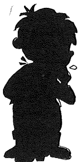
• Il mange du sanglier.

Que désigne l'expression un sanglier ? Que désigne l'expression du sanglier ?