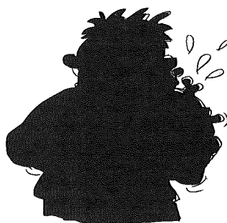
• Il mange un sanglier.