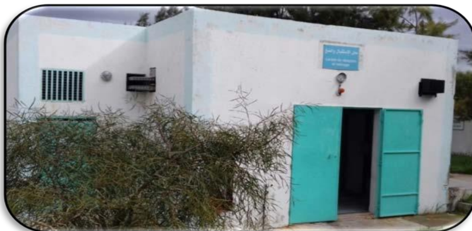
Poste de relevage

Cet ouvrage permet le pompage des eaux usées dégrillées vers le prétraitement. Les eaux sont chargées en matières en suspension (éliminer les particules des tailles supérieures à 80 à 60 mm).