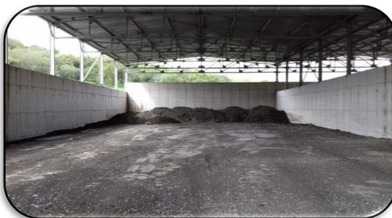
Stockage des boues