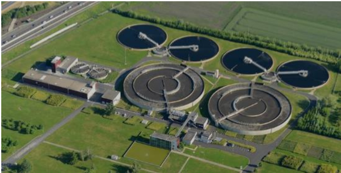
Vue aérienne d'une station d'épuration.

La première tentative d'épuration des eaux usées a été inventée en 1914 par des scientifiques anglais.