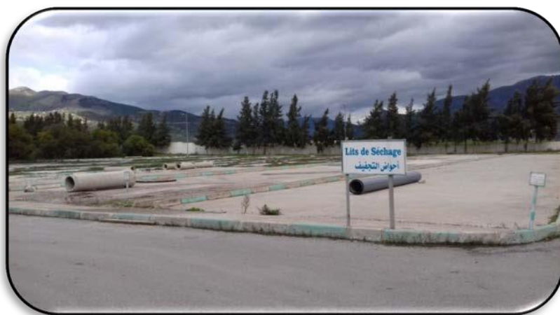
Lits de séchage

Ces boues sont généralement utilisées en agriculture comme engrais. Une fois sèches, elles peuvent aussi être incinérées ou mises en décharge.