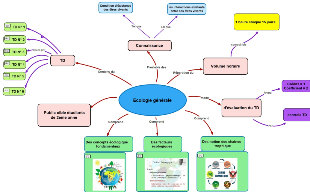
carte conceptuelle du cours