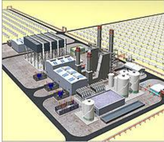
مخطط اول محطة للطاقة الشمسية في الجزائر [2]