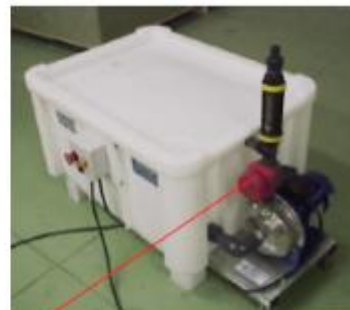
banc hydraulique et le groupe hydraulique